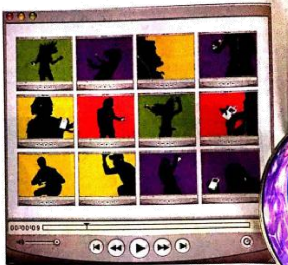
图 47 苹果 iPod 宣传广告 主题:听色彩在跳舞 亮丽的色彩,黑色剪影把音乐的感觉发挥得淋漓尽致,该系列广告风格简洁,对比强烈,具有强烈的视觉冲击力。

(3) 锁定范围:在充分联想的基础上进行创意、构思,用排除法缩小要表现的范围,锁定方向,然