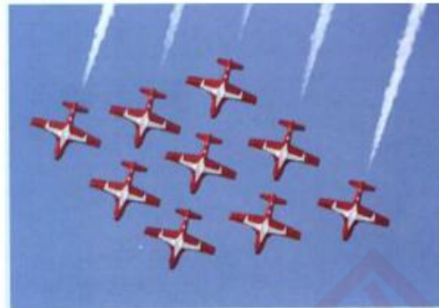
生活中的重复现象